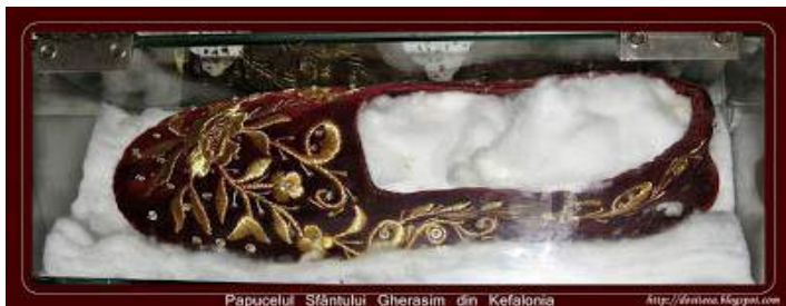
Papucelul Sfântului Gherasim din Kefalonia

V ietuitor al pustiului, ocrotitor al ortodocsilor si inger in trup, vindecator si de Dumnezeu purtator te-ai aratat noua. Pentru aceasta noi, credinciosii, te laudam pe tine, dumnezeiescule Gherasime, ca in chip vrednic ai dobandit de la Dumnezeu tamaduiri si harul vesnic, pe cei bolnavi ii vindeci, pe demoni ii alungi, iar celor ce te cinstesc pe tine le izvorasti tamaduiri. Vlastar dumnezeiesc al Peloponezului si comoara nepradata a Kefaloniei, lauda cea mare a intregii Elade, Sfinte Gherasime, de Dumnezeu purtatorule, ocroteste pe robii tai ! ( Troparul sfantului )